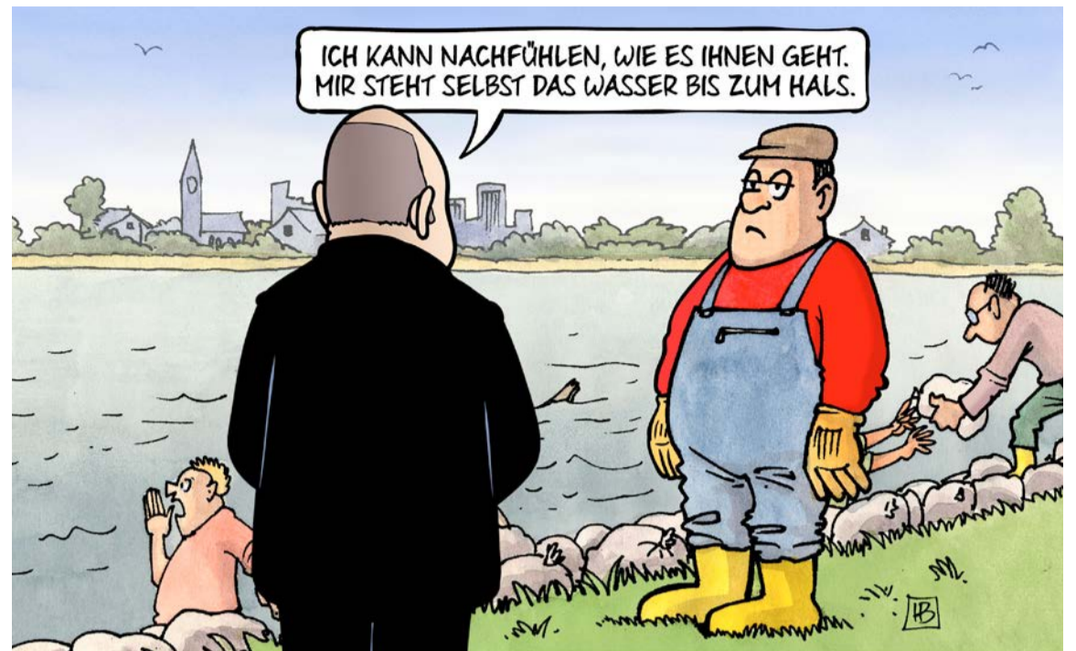
Karikatur: Harm Bengen/toonpool.com