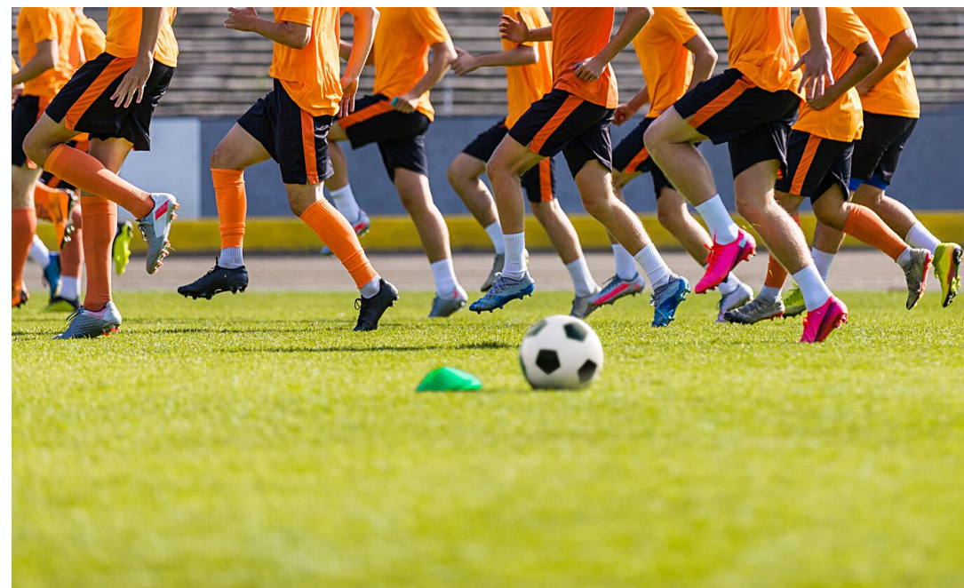
Club de football 250 licences

6 jours pour les membres du comité (gestion courante, réunion internationale, formation international)