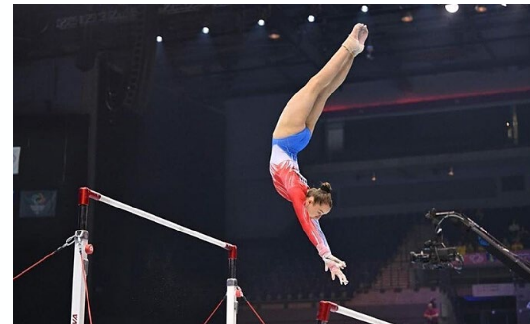
FLGym: >5000 licences

ATTENTION: le cumul n'est pas applicable pour les organismes (fédérations, clubs, COSL, LPC) mais pour les personnes physiques!